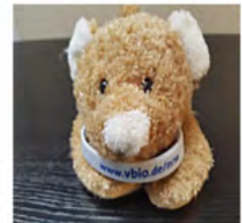
Unser NRW- Wischbärchen. Ideal zum Säubern von Handy-, iPad und Rechnerfenster! Ist aber auch als Deko oder zum Knuddeln geeignet.